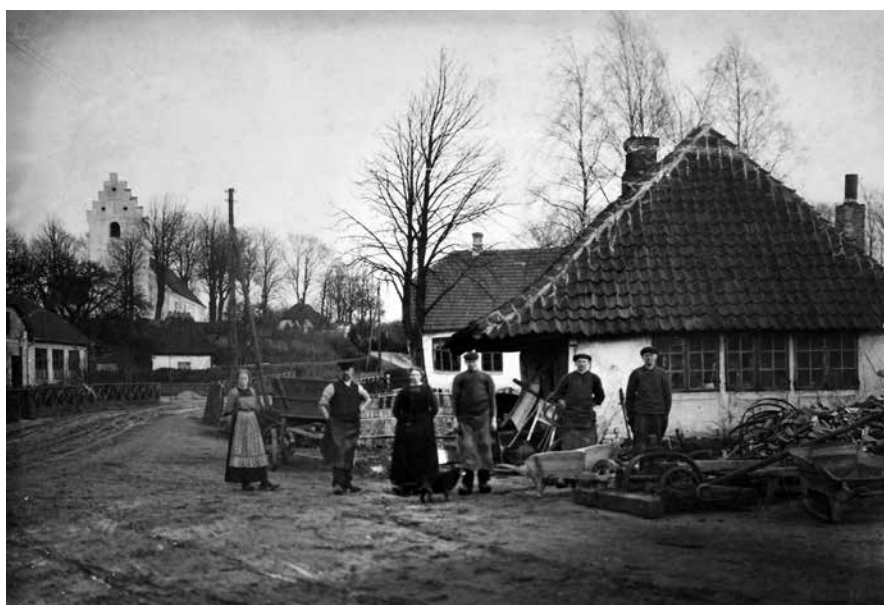
Den gamle Aasum Smedie ligger midt i landsbyen. Her er den fotograferet omkring 1900.