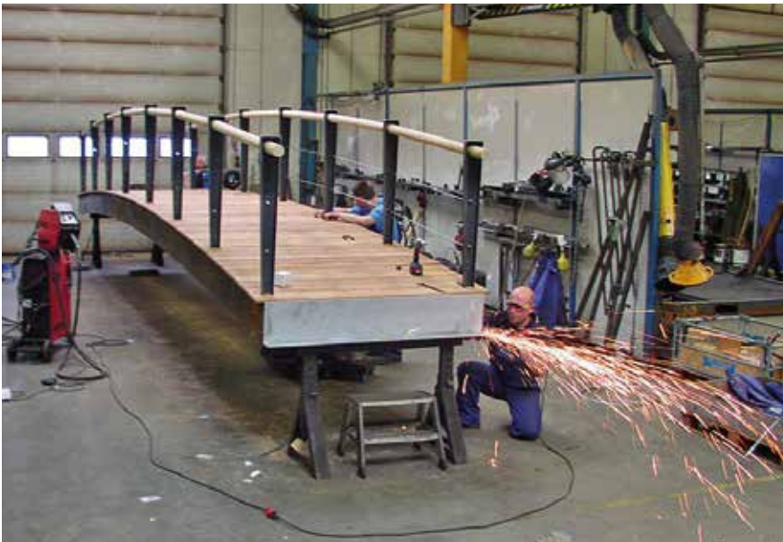
By- og parkudstyr er et voksende forretningsområde for Aasum Smedie. Her er man ved at lave en gangbro.

i takt med at miljømæssige aspekter fik større og større opmærksomhed i samfundet.