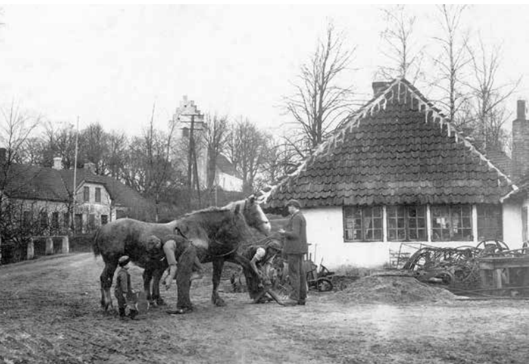
Til venstre: Et par heste bliver skoet uden for Aasum Smedie omkring 1930.