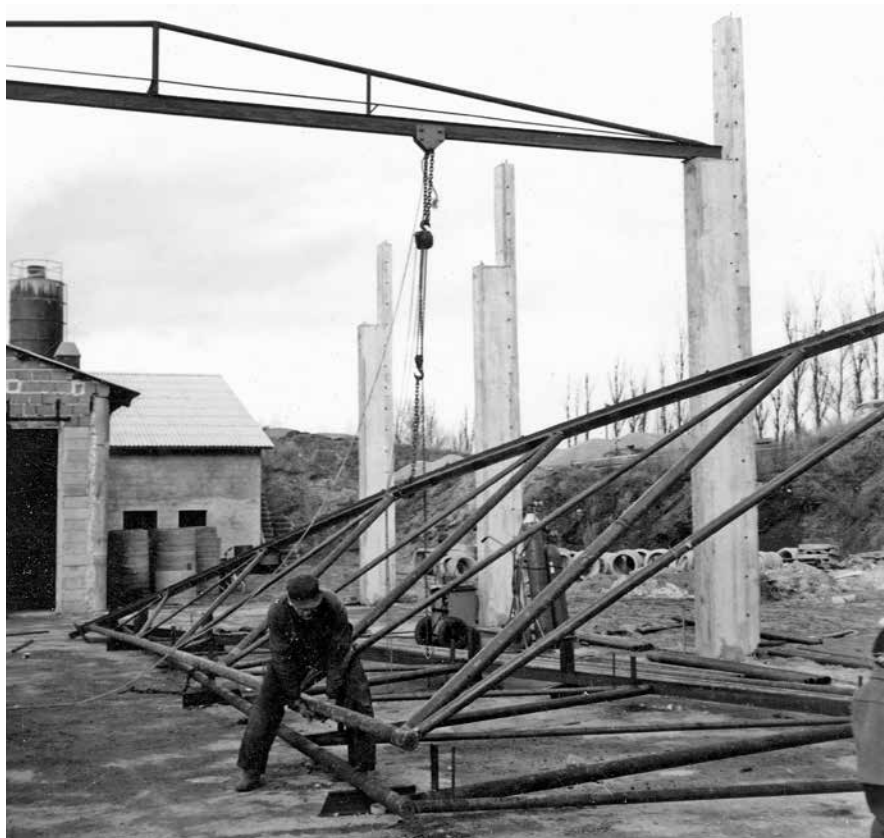
I 1960'erne og 1970'erne blev drivhus-, fabriks- og landbrugsbygninger et stort arbejdsområde for Aasum Smedie.

Drivhuskonstruktionerne blev i 1960'erne Aasum Smedies største indtægtskilde. Den medførte også, at virksomheden voksede og fik flere ansatte. I begyndelsen af 1970'erne var der således ansat 10-15 i virksomhe-